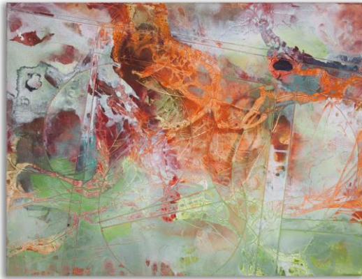
Frank Rödel - Von der Struktur zum Chaos, 2023, 130 x 170 cm, Mischtechnik auf Leinwand www.frank-roedel.de