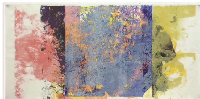
Kama Jackowska - OT, aus Serie: Big Bang/Urknall-Theorie, 2022-23, jew. 70 x 140cm, Siebdruck Unikat auf Papier www.kamajackowska.com