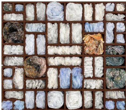
Helga Wagner - art recycling case, 2023, 47,5 x 54,5 x 8cm, Holz, Acryl, Sand, bemalte Plastikfolie www.helga-wagner-art.de