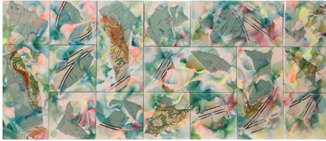
Sabine Schneider - Splitting World (16-tlg), 2023, 90 x 210cm, Collage und Öl auf Leinwand www.kunst-sasch.de