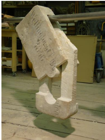
Robert Schmidt-Matt - Baumeln, 2009, 59 x 29 x 13 (Block), 73 x 50 x 13 (geöffnet), Sandstein auf Edelstahlrohr www.schmidt-matt.de